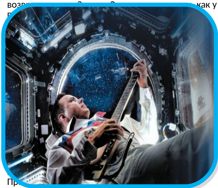
Пр... исполнителем в одном лице.

Сложно было одновременно играть на гитаре, петь и красиво вращаться в невесомости, потому что тело движется по траектории, которую не угадать. Пришлось повозиться, но оно того стоило! Иметь какой-либо музыкальный инструмент на МКС – традиция. Чего только здесь не было: скрипка, саксофон, флейта. Я изначально брал с собой губную гармошку, поскольку при старте личный багаж не может превышать одного килограмма. Но позже на станцию могут доставить вещи грузовым бортом. Так мне и передали гитару. Когда гимназия №2 отмечала свой полувековой юбилей, космонавт не смог приехать на торжества. Однако он прислал своим учителям поздравительное письмо.